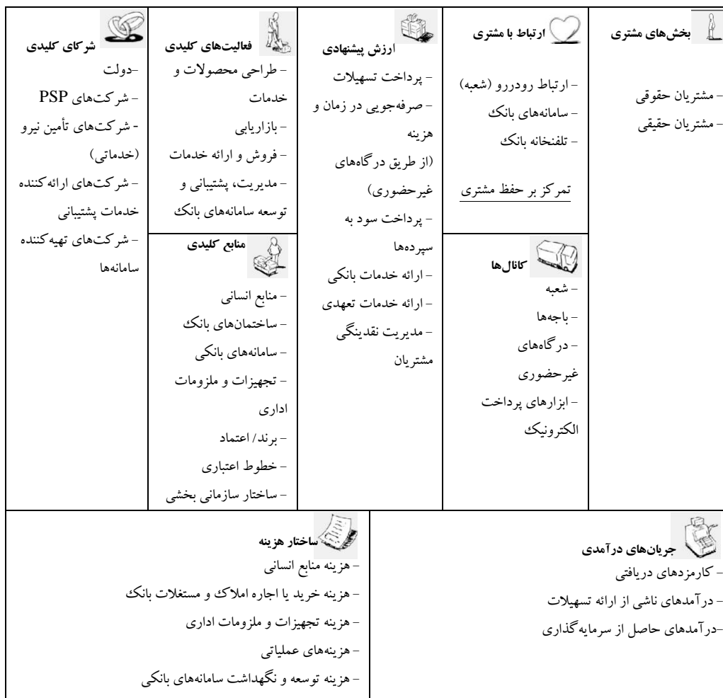
جدول ۱۲. مدل کسب‌وکار موجود بانک