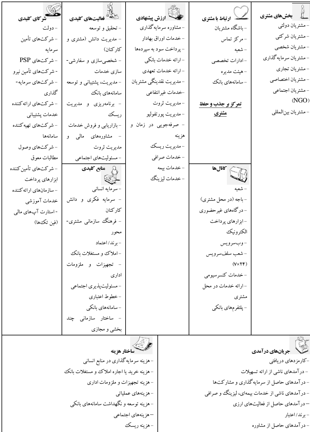
جدول ۱۳. مدل کسب و کار آتی بانک