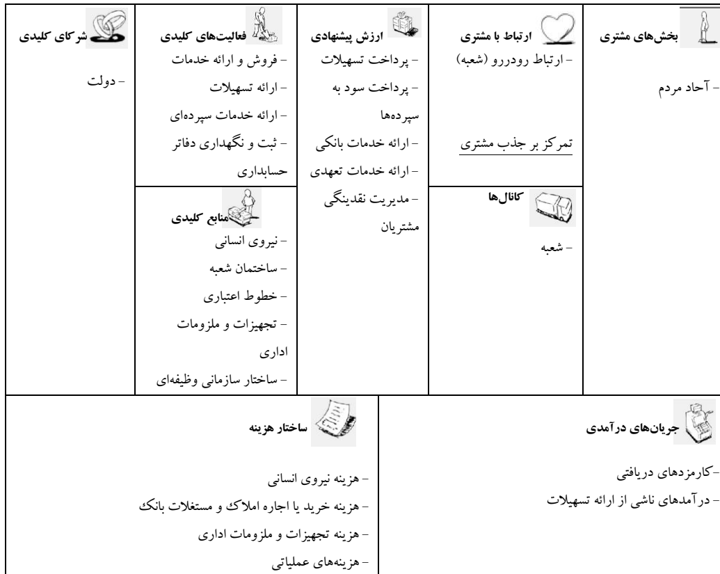
جدول ۱۱. مدل کسب و کار گذشته بانک