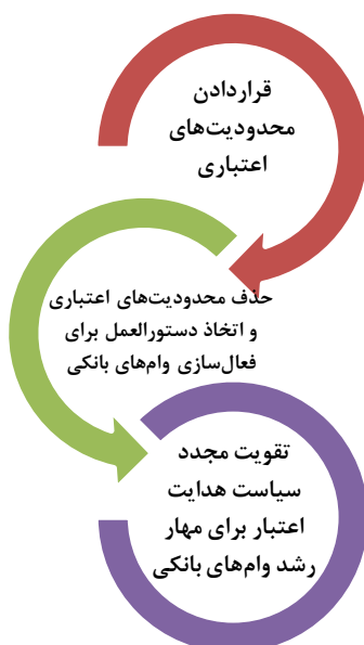
شکل ۱: روند سیاست‌های هدایت اعتبار در چین

- جریمه برای عدم رعایت سیاست‌های هدایت اعتبار: عملیات تنبیهی از طریق عملیات بازار باز توسط بانک مرکزی برای مؤسسات مالی و بانک‌هایی که رویکردی خلاف سیاست‌های بانک مرکزی را دنبال می‌کنند، اعمال می‌گردد. (فو کوموتو و همکاران، ۲۰۱۰) بانک مرکزی چین این سیاست‌ها را در طول زمان با توجه به اقتضای زمانی اقتصاد کشور تغییر می‌دهد. با این حال، تغییرات عمده انجام شده بر سیاست‌های هدایت اعتبار از سال ۲۰۰۷ تاکنون را می‌توان در سه مرحله زیر خلاصه نمود: